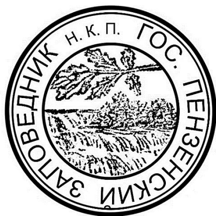
Рис. 4. Отреставрированный оттиск печати, встречающийся на гербарных листах в гербарии им. И.И. Спрыгина (РКМ 11 ) Пензенского государственного университета.