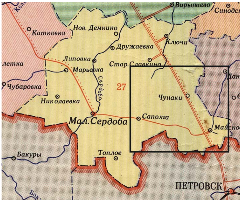
Рис. 1. Место расположения района исследований