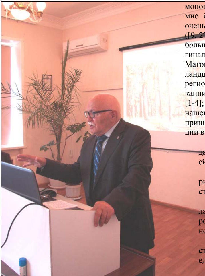
Выступление в ИЭВБ РАН 30 мая 2017 г.

Естественно, я был знаком с некоторыми научными работами Г.М. Абдурахманова; я знал его как выдающегося энтомолога, специалиста по жесткокрылым Кавказа (работы [1-4,