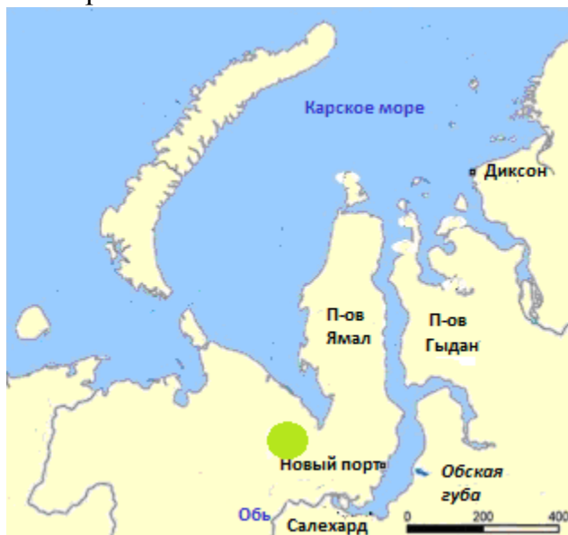
Рис. 1. Район исследований в окрестностях реки Еркута

Почвенный покров Севера требует детального изучения в условиях возрастающих геополитических и экологических рисков, а также в связи с осуществлением в Российской Федерации «Социально-экономическое развитие Арктической зоны России на период до 2020 года». Ямальский регион – стратегически важный район для развития России. В настоящее время здесь активно разрабатываются месторождения полезных ископаемых и развивается инфраструктура (порты, трубопроводы и пр.). В условиях полярных экосистем почва играет важнейшую роль в плане функционирования геохимических потоков в ландшафте. Помимо этого она выполняет функцию аккумуляции, трансформации и перераспределения химических элементов (Горячкин, 2010). Изучение таксономического и функционального разнообразия почв позволяет делать выводы о почвообразующем потенциале окружающей природной среды Ямальского региона.