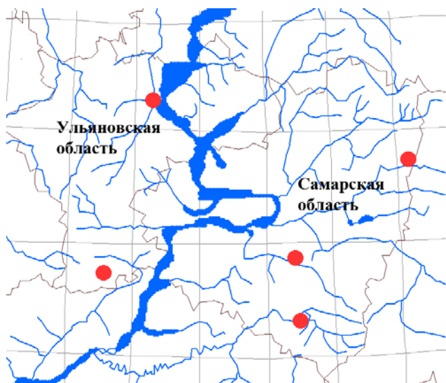
Рис. 3. Распространение по территории Самарской и Ульяновской областей по базе данных FD SUR Euclidium syriacum (L.) Ait