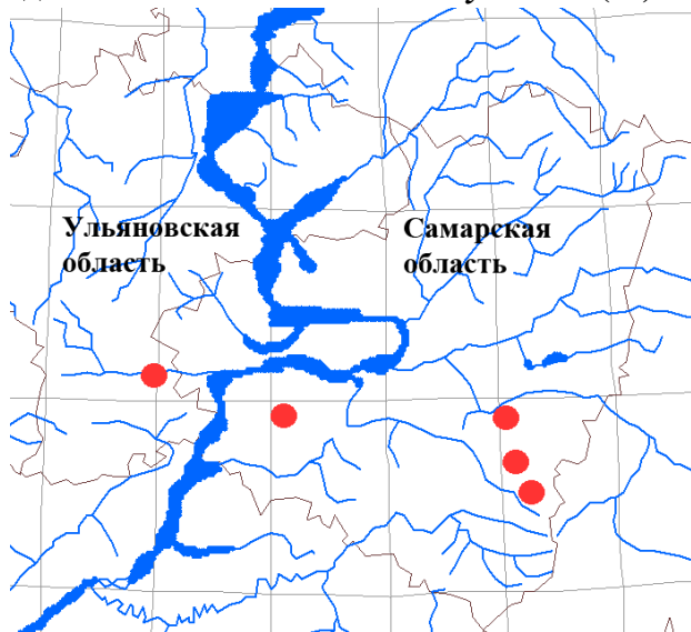
Рис. 4. Распространение по территории Самарской и Ульяновской областей по базе данных FD SUR Petrosimonia litvinovii Korsch.

проводящиеся на базе Института экологии Волжского бассейна РАН, приносят значительную часть сборов в фонд гербария. В 2015 г. XIV экспедиция-конференция проходила по территории Самарской и Ульяновской областей. В ней участвовала группа специалистов-ботаников из Института экологии Волжского бассейна РАН, Пензенского государственного университета, Поволжской социально-гуманитарной академии, Самарского государственного экономического университета. Для изучения флоры Самарской области материал был собран из Безенчукского, Приволжского районов (Заволжье, степная зона) и Сызранского (Предволжье, лесостепная зона).