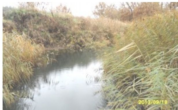
Рис. 2. Малая река Черновка

Гидрологические и гидрохимические наблюдения проводились в 2004-2005 годах на реке Большой Кинель в районе населенного пункта Тимашево. Пробы воды отбирались выше по течению от питьевого водозабора г. Отрадного с глубины 0,5 м. В 2004 году пробы отбирались 1 февраля, 12 апреля, 19 сентября и 7 декабря, а в 2005 году – 19 марта, 23 июня, 27 сентября и 7 декабря. Для химического анализа пробы воды доставлялись в лабораторию МВО Института экологии Волжского бассейна РАН.