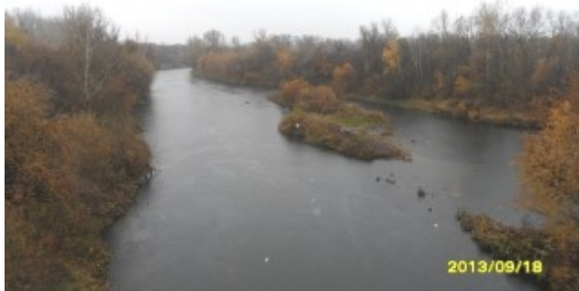
Рис. 1. Река Большой Кинель

Русло реки Большой Кинель очень извилистое. В пойме среднего течения реки встречается множество мелких старичных озер. В нижнем течении реки имеются заболоченные участки поймы.