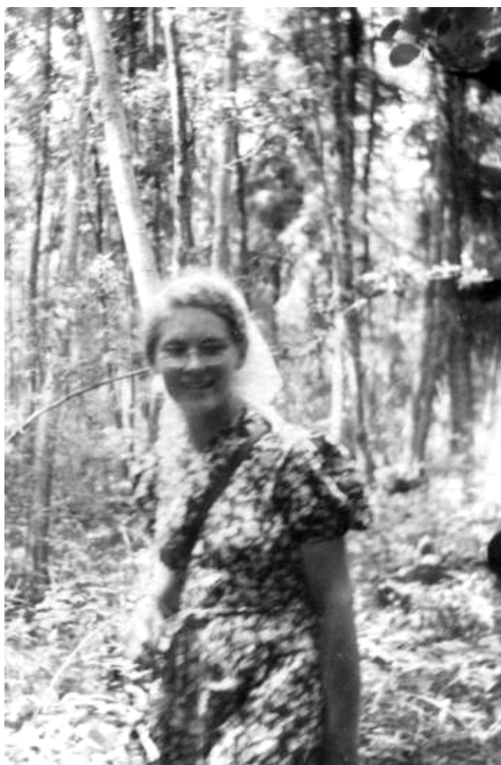
«Но улыбка её с фотографии давней дарит свет как всегда и врачует все раны...»