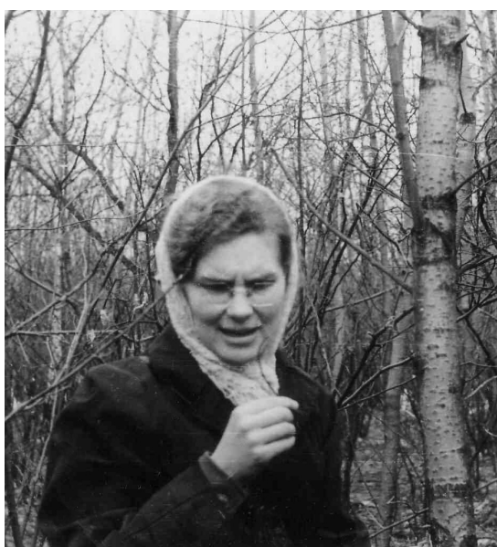
Весенняя экскурсия «Раскрываются почки,... жизнь продолжается!»