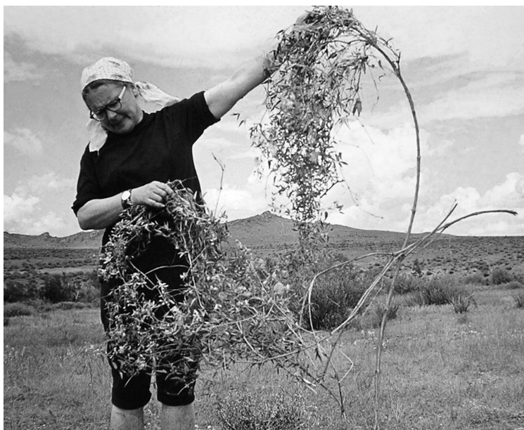
Экспедиция в Туву. «Что за чудо?!»