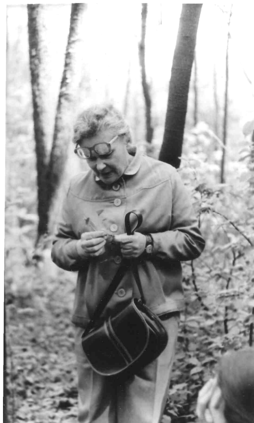
Последняя экскурсия. Сентябрь 1986 г.