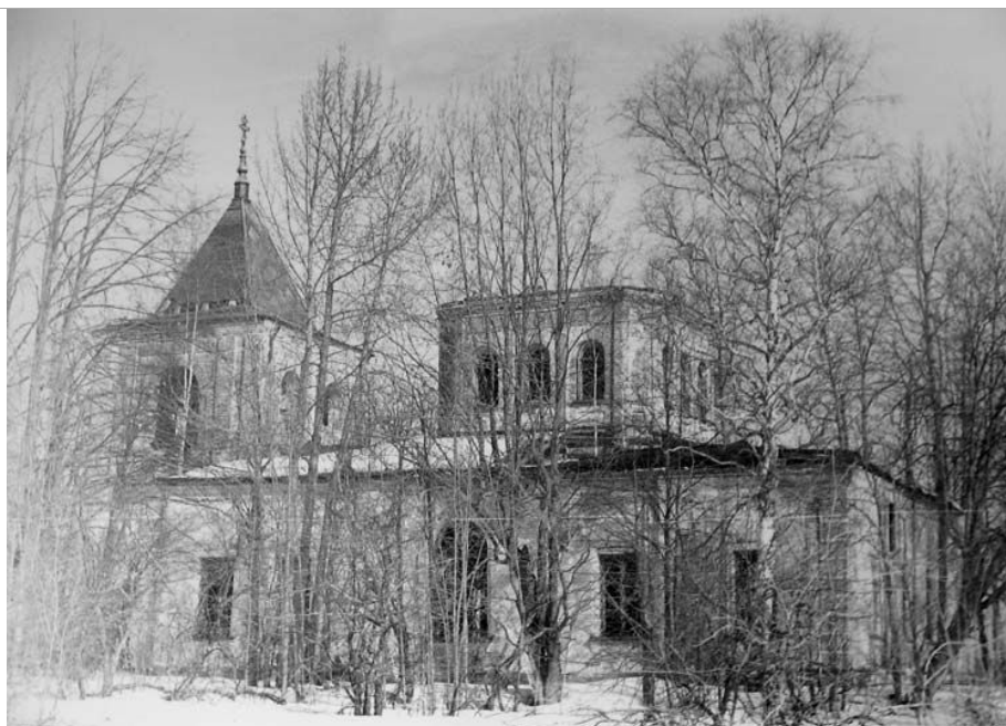
Рис. 1. Южный фасад церкви, построенной Г. С. Раменским в деревне Рамешки. Фотография Т.Н. Байковой, сделанная в 90-х годах прошлого века 8 .