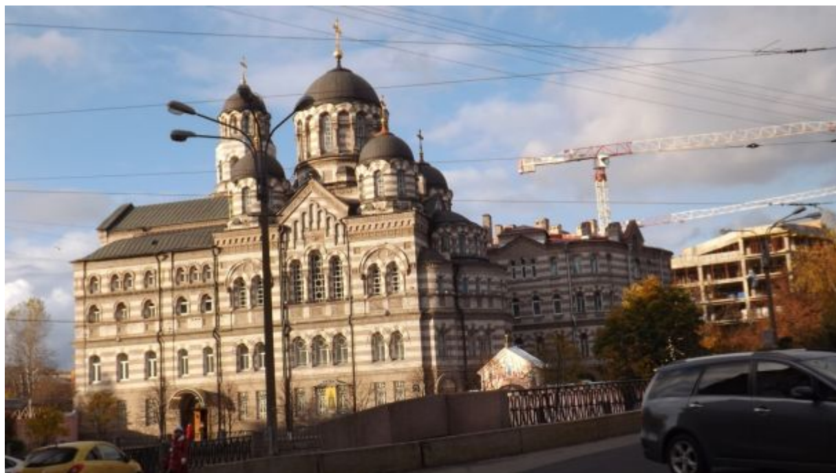
Рис. 3. Свято-Иоанновский ставропигиальный женский монастырь. Фото автора, октябрь 2012 г.

Образование Леонтия Раменского не ограничивалось посещением гимназии. По рассказу В.П. Савича, благодаря отцу, у Леонтия была большая библиотека по естествознанию и философии, химический кабинет, в котором он производил различные опыты, минералогические коллекции, гербарии и т.п. (Голуб, 2013). Это давало ему возможность самостоятельно пополнять свои знания, кроме тех, которые он получал в гимназии, а затем в Горном училище и Санкт-Петербургском университете. Имел он также и музыкальное образование, достаточно хорошо играл на пианино.