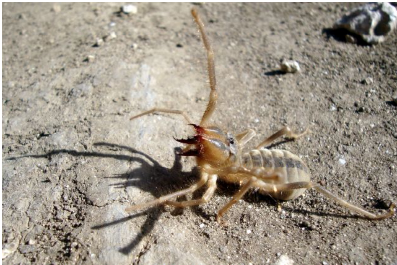
Рис. 1. Внешний вид G. araneoides (Западное побережье Крыма, Тарханкутский полуостров)

настоящее время, а их природа – менее контрастной: в степи существовала древесная растительность, видовой состав которой был близок к интразональным приречным лесам юга Украины и Предкавказья, и встречались виды животных, распространение которых ныне ограничено исключительно горно-лесной частью Крыма (Антипина, Маслов, 1984; Подгородецкий, 1994; Кукушкин, 2003б).