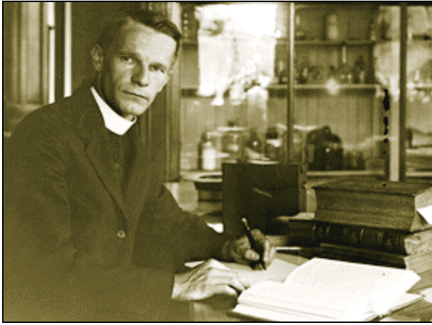
Юлиус Ньюлэнд Julius Aloysius (Arthur) Nieuwland 1878-1936