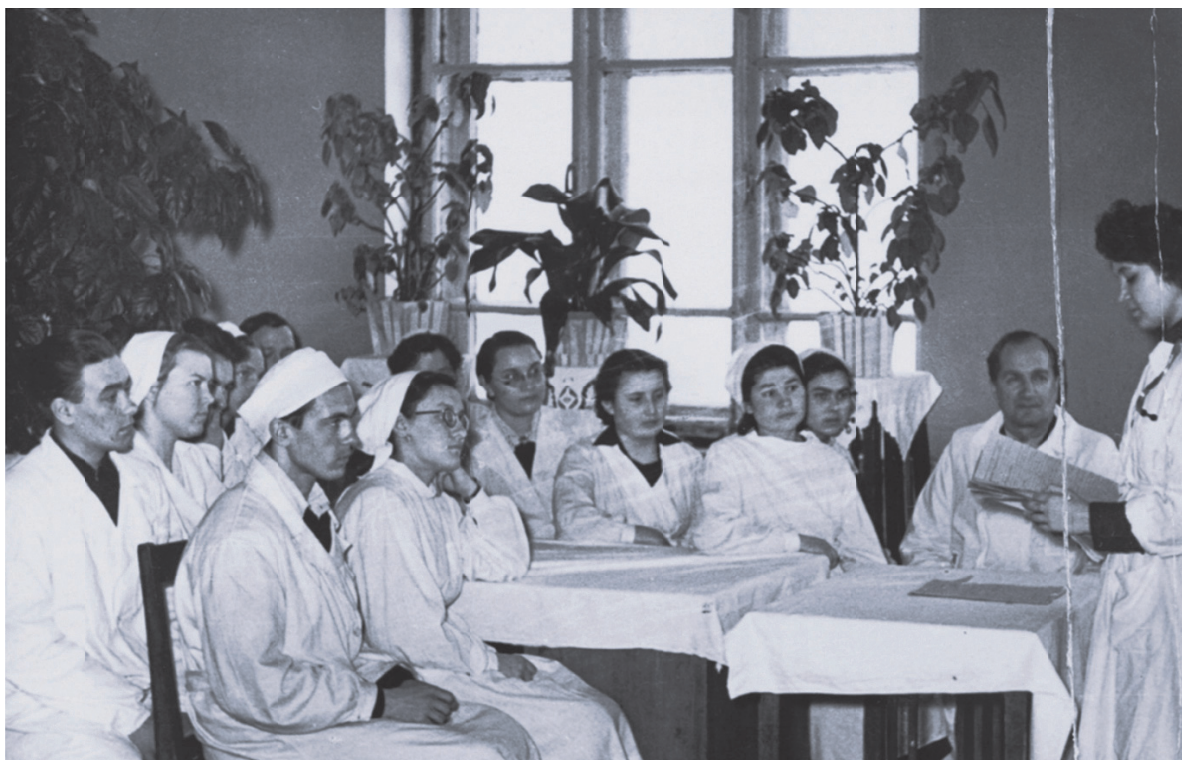
Фото 5. Заседание студенческого научного кружка кафедры