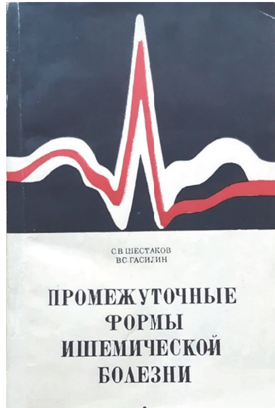
Фото 2. Титульный лист монографии, 1969 г.