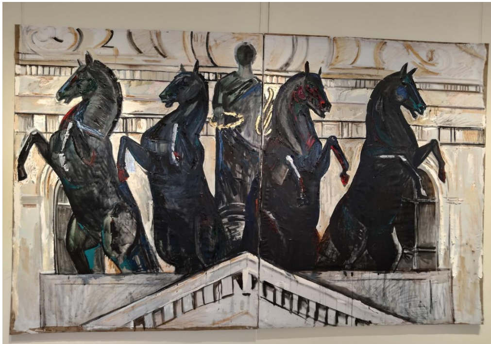
Фото 1 2 . Квадрига Аполлона, 2024. 200 x 300 см. Холст, масло, авторская техника (Quadriga of Apollo, 2024. 200 x 300 cm. Canvas, oil, author's technique)

Красное, черное, золото – эта цветовая гамма рассматриваемых далее пяти полотен становится доминирующей и не менее ярко отражает и сакральную природу театра, и барочные традиции в экспрессионизме.