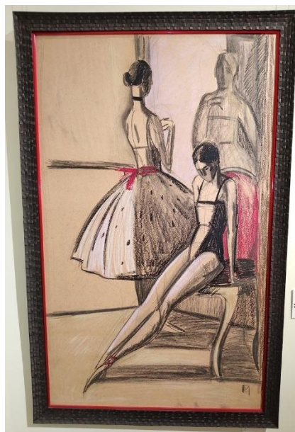
Фото 8. Балет. За кулисами, 2021. 122 x 74 см. Оргалит, смешанная техника (Ballet. Behind the Scenes, 2021. 122 x 74 cm. Hardboard, mixed media)