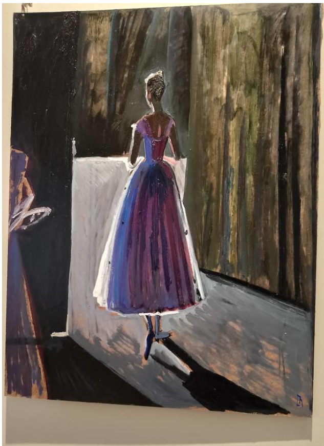
Фото 7. Из серии «Сильфида», 2024. 61 x

«Сильфида», 2024. 61 x 23 см. Оргалит, масло, акрил (From the series «Sylphide». 61 x 23 cm. Hardboard, oil, acrylic)