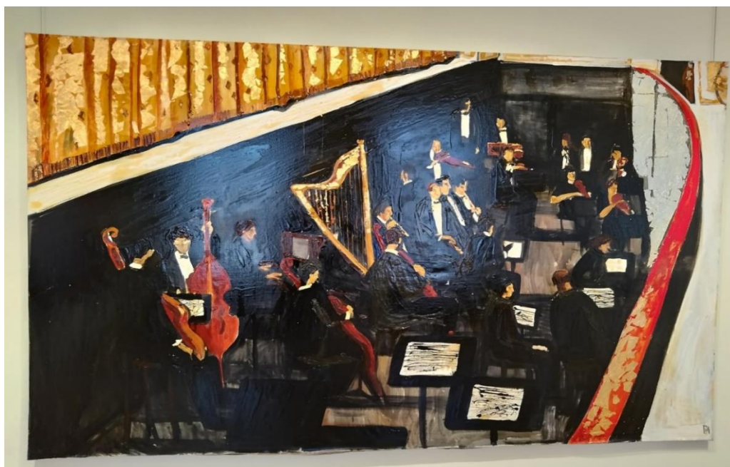
Фото 4. Из серии «Музыканты», 2024. 120 x 60 см. Оргалит, смешанная техника (From the series «Musicians», 2024. 120 x 60 cm. Hardboard, mixed media)