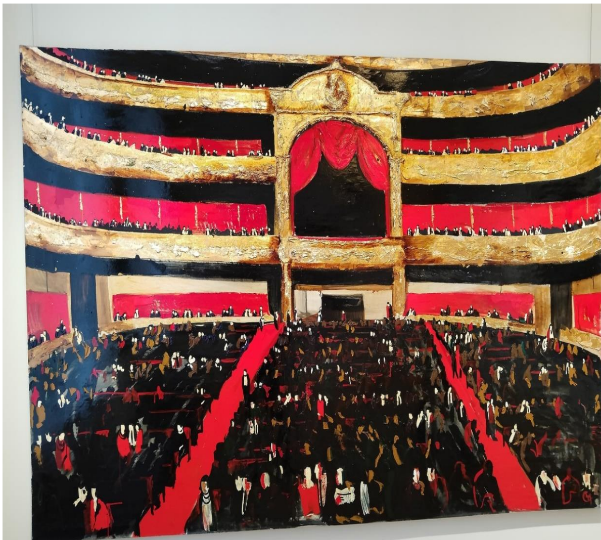
Фото 2. Большой театр, 2015. 170 x 250 см. Холст, масло (Bolshoi Theatre, 2015. 170 x 250 cm. Canvas, oil)

Два следующих полотна – из серии « Музыканты » (фото 4) – впечатляют смыслообразующими контрастами. Обе картины подобны полнотунию в природе: на первом плане – инструмент (контрабас) – ярким, оранжево-красным пятном на темном фоне. Говоря упрощенно, здесь инструмент – главное в личности музыканта, поэтому фигуры исполнителей едва