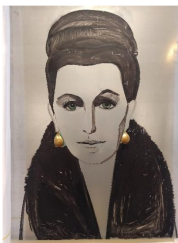
Фото 11. Портрет Галины Вишневской, 2024. 125 x 100 см. Сталь, авторская техника (Portrait of Galina Vishnevskaya, 2024. 125 x 100 cm. Steel, author's technique)

«Портрет Майи Плисецкой» (фото 12). Майя Михайловна Плисецкая (1925-2015) была в первую очередь трагической актрисой (балета, и