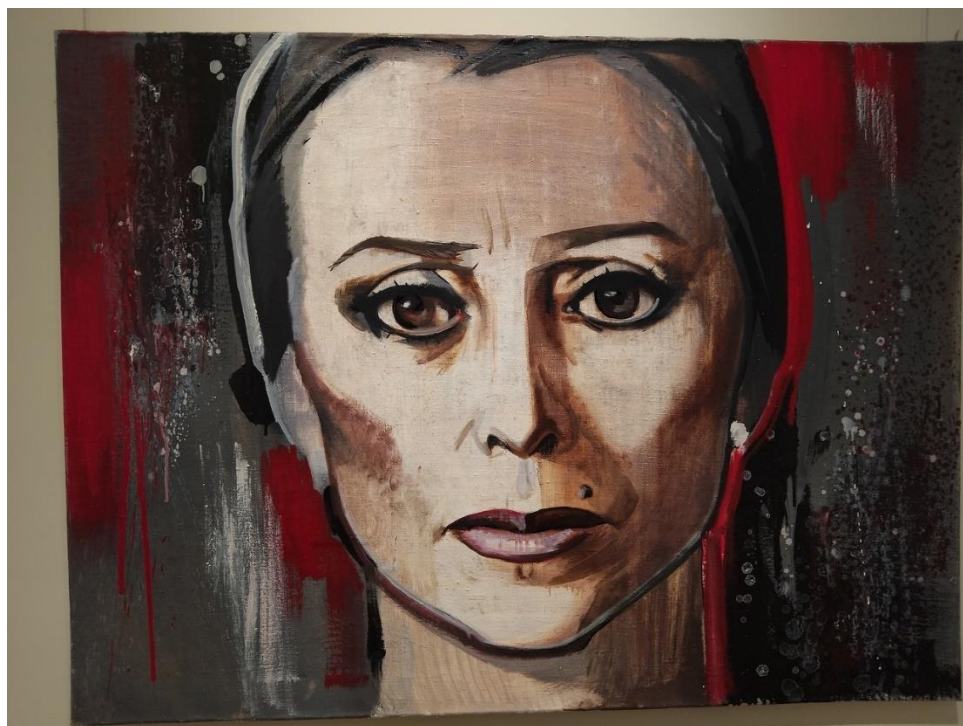
Фото 12. Портрет Майи Плисецкой, 2018. 90 x 120 см. Холст, масло (Portrait of Maya Plisetskaya, 2018. 90 x 120 cm. Canvas, oil)

Знакомство с жизнотворчеством Марии Суворовой вновь и вновь побуждает к рефлексии о психологической природе экспрессионистского мироощущения. В очередной раз возникает мысль о том, что, вопреки расхожему мнению, экспрессионистское мировидение далеко не всегда является «поэзией кошмара и ужаса» [Зивельчинская Л., с. 42] (ведь и знаменитая картина Э. Мунка – предтечи экспрессионизма – имеет массу противоречивых толкований). Художница производит впечатление вполне жизнерадостного человека и занимает достаточно активную социальную позицию: ее волнуют проблемы экологии, а своей миссией считает, как указано на справочных ресурсах, «поиск решения в