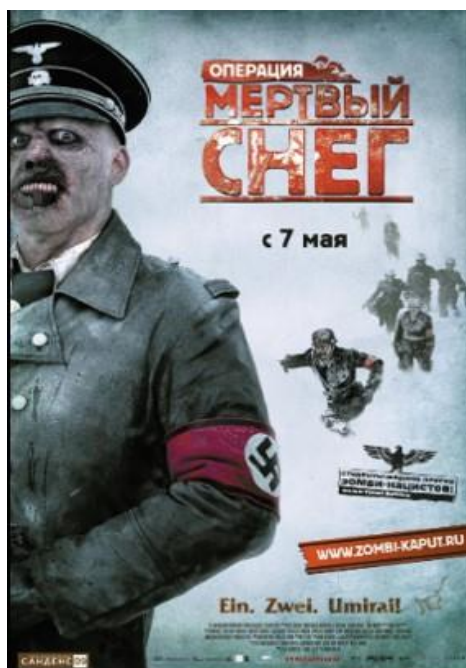
Рис. 1. Афиша фильма «Операция „Мёртвый снег“» (2009) (Poster for the film Operation Dead Snow)