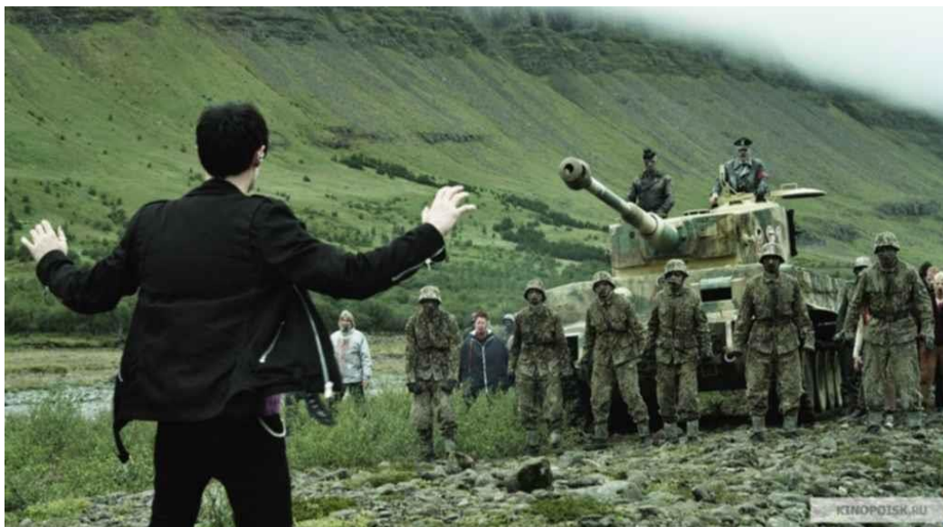
Рис. 2. Кадр из фильма «Операция „Мёртвый снег“ 2»: молодой американец-гей останавливает немецкий танк (Still from the film «Operation "Dead Snow 2"»: a young gay American stops a German tank)

«Жадность – поэтому вы и проиграли войну», - говорит главный герой штандартенфюреру (т. е. в основу Победы легла вовсе не сила советской армии и ее союзников).