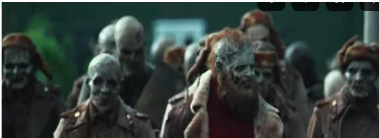
Рис. 5. Кадр из фильма «Операция „Мёртвый снег“ 2»: образ советского солдата (Still from the film «Operation "Dead Snow 2"»: the image of a Soviet soldier)