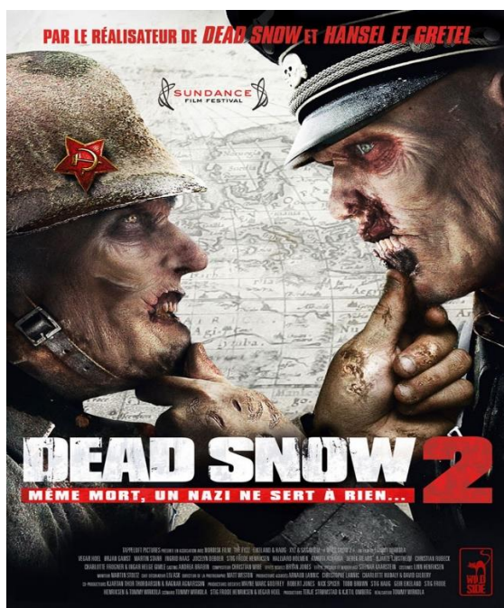
Рис. 10. Афиша фильма «Операция „Мёртвый снег“ 2» (Poster for the film «"Operation Dead Snow 2"»)

Создатели фильма беспокоились о резонансе в своей стране, учитывая, что Норвегия была оккупирована в течение четырех лет, однако никакой критики фильм не вызвал [10].