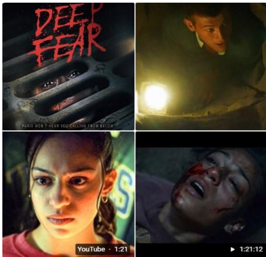
Рис. 11. Реклама фильма «Подземный ужас» в пабликах социальных сетей (Advertisement of the film «Underground Horror» in social networking publics)

Внешность у немецкого офицера невнятная: то ли призрак, то ли под воздействием амфетамина выглядит, как зомби. Но так же выглядит и его зловещая собака.