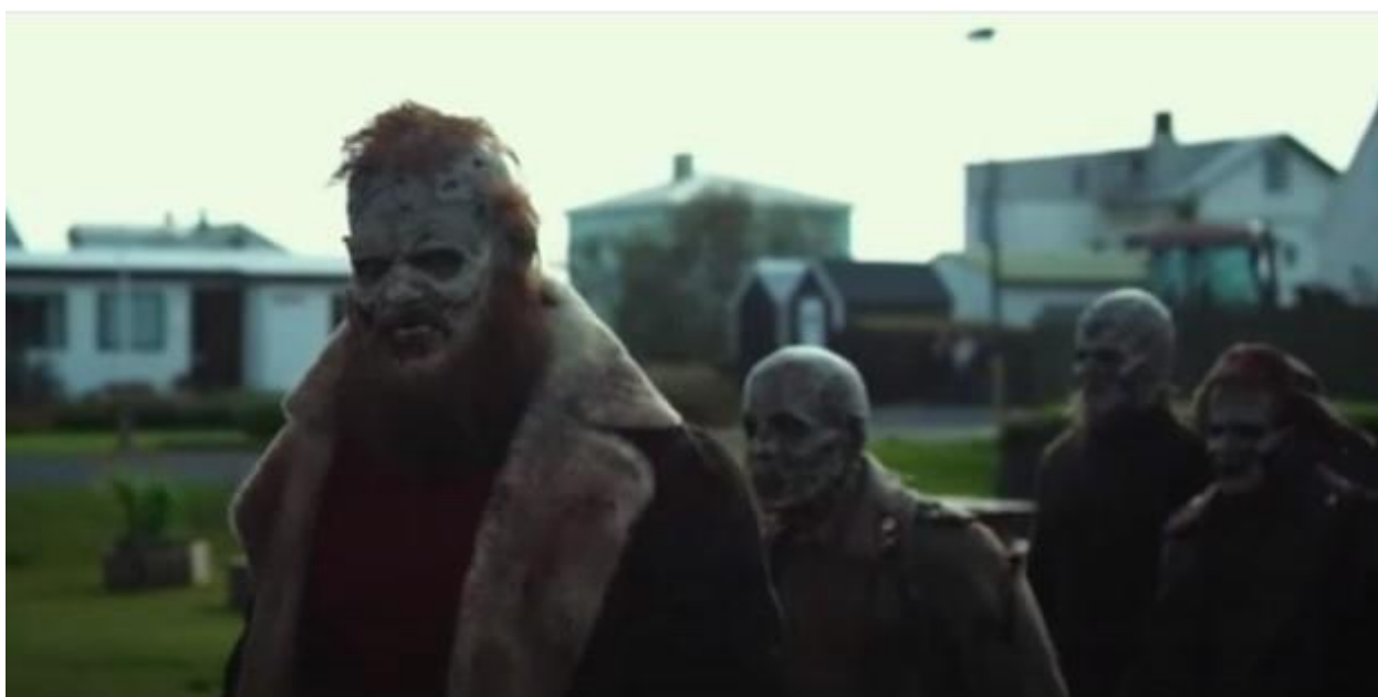
Рис. 3. Кадр из фильма «Операция „Мёртвый снег“ 2»: лейтенант Ставарин (Still from the film «Operation "Dead Snow 2"»: Lieutenant Stavarin)

шапки-ушанки у русских солдат – оживших пленных, отчасти и без формы и знаков отличия, без головных уборов (рис. 4). Вызывает вопрос: почему авторы выбрали для сопротивления немецким зомби-солдатам советских пленнх (!) зомби-солдат, тогда как север Норвегии был освобожден именно советскими войсками осенью 1944 г., (основная фашистская группировка на юге страны капитулировала 8 мая 1945 г.).