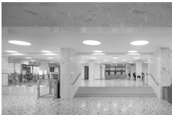
Рис. 4 Национальная библиотека Республики Татарстан. Россия (National Library of the Republic of Tatarstan. Russia)

тека для школы, но она также доступна и для студентов, то есть не является изолированной [6, 7]. Для проведения системного анализа следует рассмотреть современный опыт проектирования медиатек на территории России. Наиболее ярким примером является Национальная библиотека Республики Татарстан, расположенная в здании, построенном в 1987 г. для Казанского филиала Центрального музея Ленина [7]. В 2020 г. центр полностью реконструировали с учетом исторической архитектуры Татарстана и с отголосками советского наследия. Это заметно и в отношении использования материалов (рис.4), и в организации пространства.