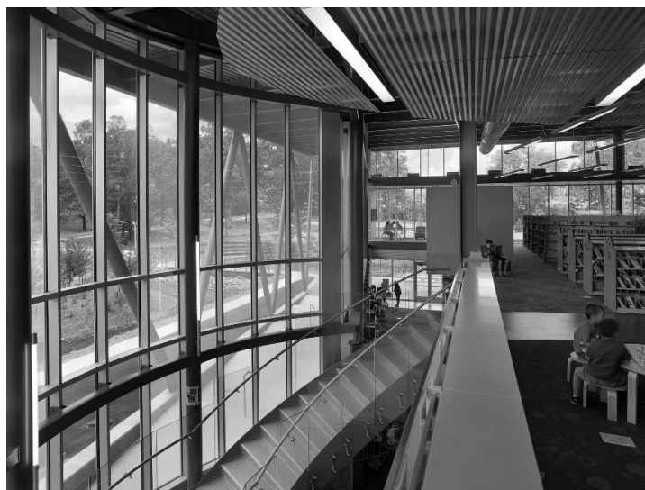
Рис. 1. Детская библиотека и учебный центр в Литл-Рок, США (Children's Library and Learning Center in Little Rock, USA)

Стоит рассмотреть самый выдающийся проект – детская библиотека и учебный центр в Литл-Рок, США [1,2]. Данная детская библиотека вмещает в себя различные функции, помимо классической библиотеки, но и пространства для выступлений, учебную кухню, теплицу и огород, а также дендрарий. Цель данного проекта – создание игровой среды без оборудования, (рис.1) где воображение и природа объединяются для создания незабываемых приключений на природном объекте площадью 24.281м 2 .