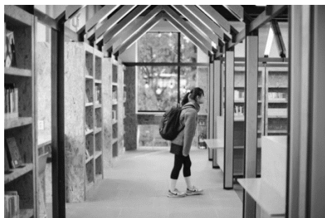
Рис. 2 Детская медиатека от бюро EUS+ARCHITECTS, Корея (Children's media library by EUS+ARCHITECTS, Korea)

Следующим объектом, который заслуживает внимания, является детская медиатека от бюро EUS+ARCHITECTS, построенная в 2019 г. (рис.2): площадь здания 3.397 м 2 [5].