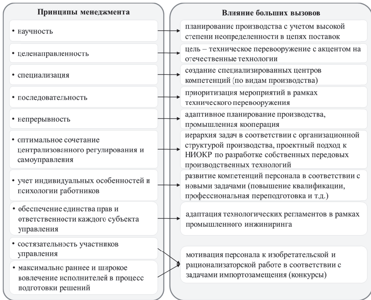
Рис. 2. Особенности реализации принципов производственного менеджмента в условиях технологического суверенитета (базируется на источниках [1,3] и дополнено автором)

временные перспективные инструменты оптимизации процессов, атрибутами которой являются направления диагностики результатов производства, принципы производственного менеджмента, модифицированные с учетом скорректированных стратегических целей, показатели результативности производства на фоне обеспечения технологического суверенитета и цели интегрированного управления производственными результатами (рисунок 3).