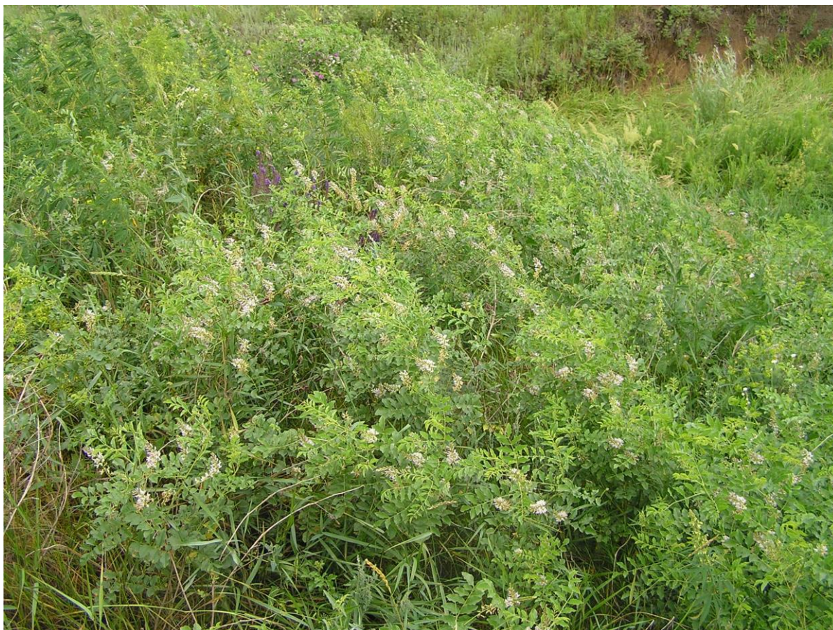
Рис. 1. Ценопопуляция Glycyrrhiza glabra L. (Большеглушицкий район Самарской области)

Широко известно применение солодки как лекарственного растения, однако есть и другое ее значение, например, отмечается возможность использования вида при рассолении почв (Ibraeva, Makhanova, 2024).