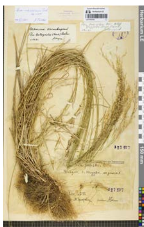
Poa saksonovii Tzvelev