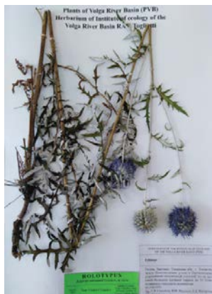
Echinops saksonovii Vasjukov