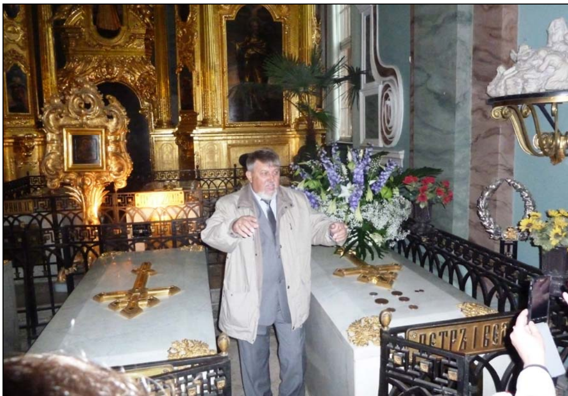
Возложение цветов на могилу Петра I в Петропавловской крепости (23 июня 2014 г.; фото автора).