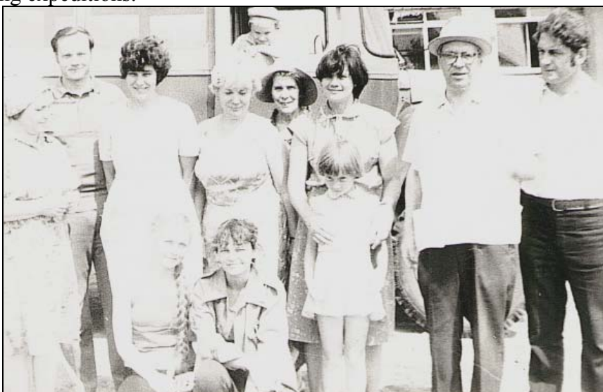
Рис. 6. Экспедиции куйбышевских ботаников. Fig. 6. Expeditions of Kuibyshev botanists.