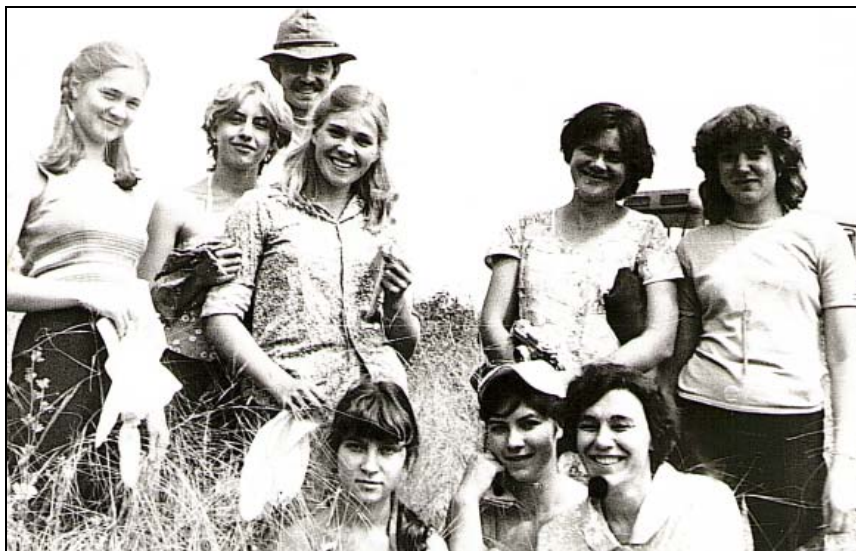
Рис. 5. Во время экспедиций. Fig. 5. During expeditions.