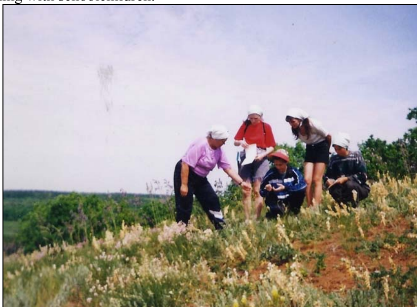
Рис. 9. Работа со студентами. Fig. 9. Working with students.