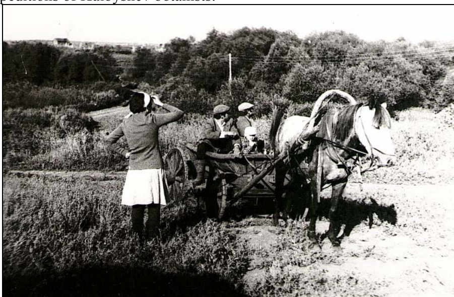
Рис. 7. Не только на автобусе, гужевой транспорт во время экспедиции тоже в моде. Fig. 7. Not only by bus, horse-drawn transport during the expedition is also in vogue.