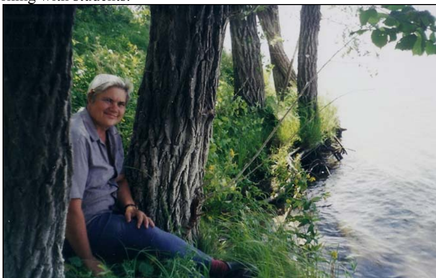
Рис. 10. Родные места – волжская пойма. Fig. 10. Native places - the Volga floodplain.