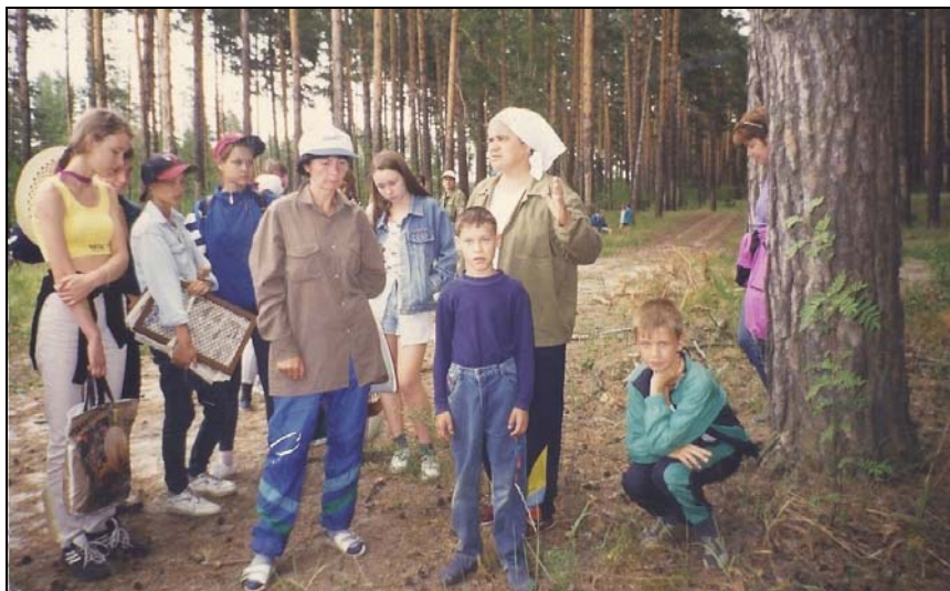
Рис. 8. Работа со школьниками. Fig. 8. Working with schoolchildren.